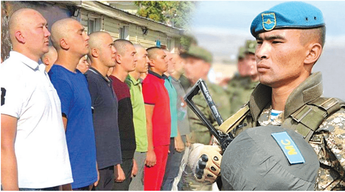
Әсеп БАЛТАҚЫЗЫ (қолжазба)

Енді әңгіменің тоқтатылуына көшсек, «Ашық НҚА» порталында әдетте түрлі заң, қаулылар мен бұйрықтардың талқыланатыны бар. Сол порталда «Қазақстан Республикасының кейбір заңнамалық актілеріне резервтік қызмет мәселелері бойынша өзгерістер мен толықтырулар енгізу туралы» заң жобасының тұжырымдамасы жарияланған. Сырт көзге әдеттегі көп құжаттың бірі болып көрінуі мүмкін. Алайда резерв қызметін жүзеге асырудың елдің қорғаныс қабілетін арттырудың өзекті екені сөзсіз. Ал тұжырымдамада қабылдана қалған жағдайда 2024 жылдан бастап енгізілетін жаңа ережелер ашық сипатталған. Айталық, тұжырымдамада қазіргі заманғы қарулы жанжалдар әскери сипаттағы қауіп-қатерді ресурстары мықты армия ғана шеше алатыны айтылған. Яғни, жаңа тұжырымдамаға сәйкес, армияның заманауи қару-жарақ және техникамен қамтамасыз етілуінен бастап, қажет кезінде әскери машықтарды игерген азаматтарды әскер сапына мольнан тарту, көлік-логистикалық кешендердің мүлтіксіз жұмыс істеуі, экономиканың ұрыс жағдайына бейімделу қабілетінің сақталуы тәрізді көптеген фактор ескеріледі деген сөз. Дегенмен құжатта экономика немесе инфрақұрылымға емес, адами ресурстарына көбірек мән берілгенін атап өткен жөн. Бір жағынан бұл дұрыс шығар. Қазақстанда бүгінде әскери өнім шығаратын 24 зауыт бар. Оған тамыздан бастап атышулы АК немесе Калашников