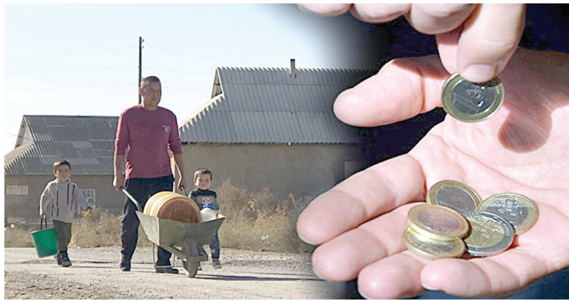
Әсеп БАЛТАҚЫЗЫ (қолжазба)

Қазір ауылдан үлере көшіп жатқан жастар өз болашағын қаламен байланыстырады. Өйткені үлкен шаһардың мобильділік, балабақша, мектеп, өкімшілік пен медициналық қызмет бойынша инфрақұрылымы жақсы дамыған. Ал көп ауылдың жағдайы кісі қызығарлықтай емес. Ондай жерде жұмыс істеуге жастарды күштеп көндірудің нәтиже бермесі анық. Сондықтан алдымен ауылдағы жас маманға лайықты жағдай жасалуы тиіс. Шалғай елді мекендерде жана кәсіппен айналысу үшін оларға жеңілдетілген несиелер беріп, мем-